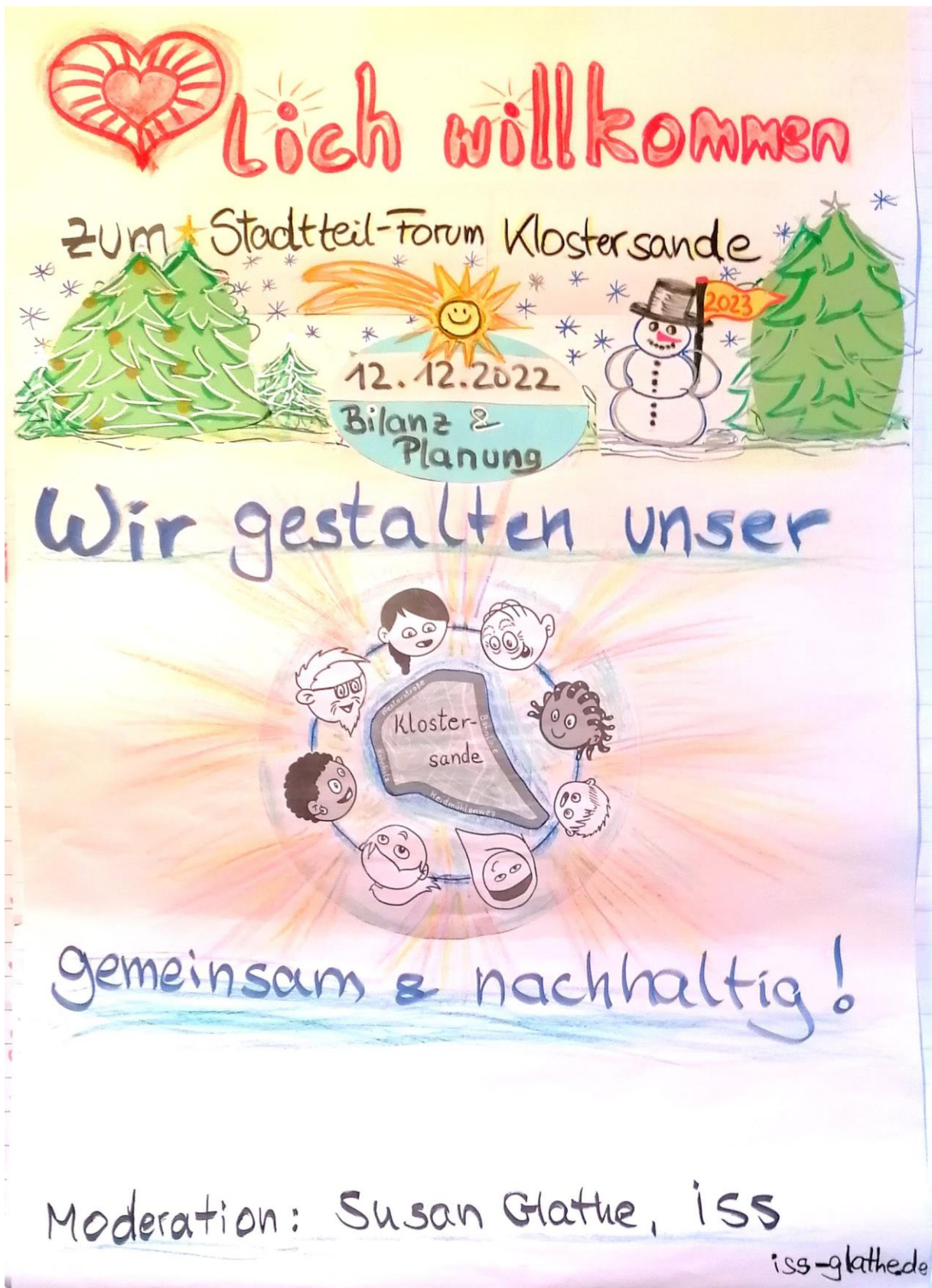
Foto-Protokoll Stadtteilforum Klostersande 12. Dezember 2022